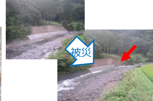
災害復旧工事中に豪雨により被災し、コンクリートブロックの崩壊等が発生 (受注者負担額約320万円)