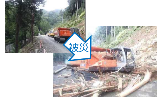
災害復旧工事中に台風により被災し、重機の水没等が発生 (受注者負担額約660万円)