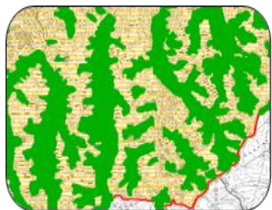
大規模盛土造成地マップを全国で作成、公表 (R2.3)