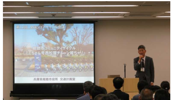
姫路市都市局交通計画室 姫路市コミュニティサイクル 『ミニちゃん号西松屋チェーン姫ちゃり』