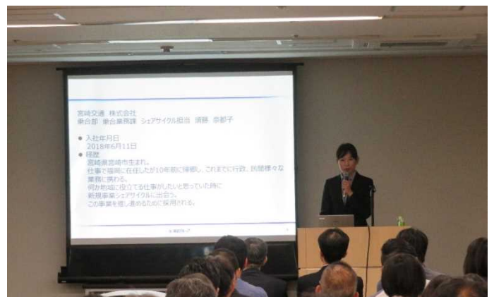
宮崎交通株式会社 シェアサイクルサービス「宮交PIPPA」導入と展開について