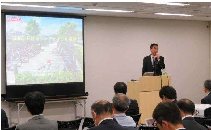
京阪電気鉄道株式会社 京都におけるシェアサイクル事例