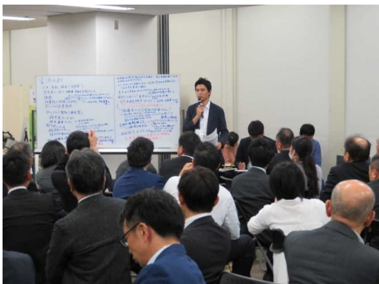
【テーマ③シェアサイクルの事業運営】