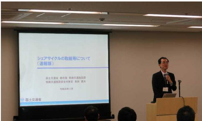
国土交通省都市局街路交通施設課 シェアサイクルの取組等について