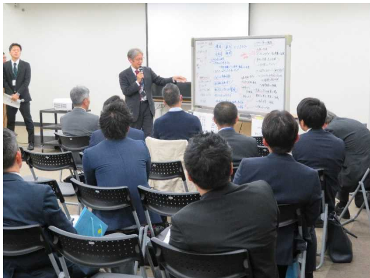
【テーマ②まちづくり・観光振興とシェアサイクル】