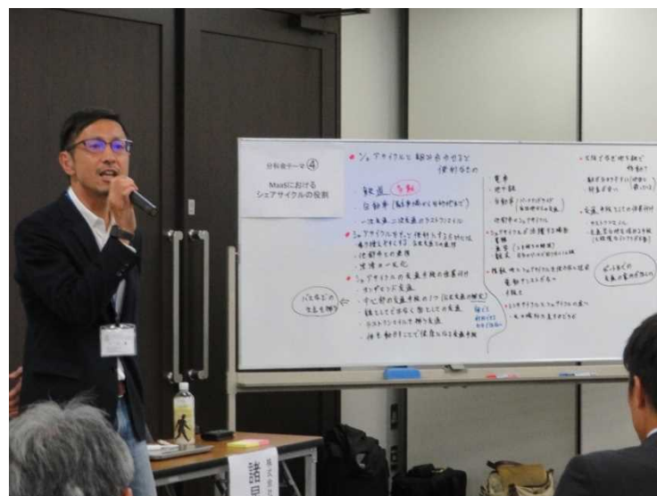
【テーマ④MaaSにおけるシェアサイクルの役割】