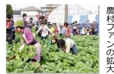
農村ファン の拡大