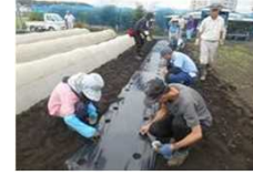
都市農業アドバイザーの派遣