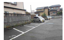
老朽化した駐車場を農地等への整備