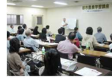
税・相続に関する講習会