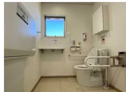
トイレのバリアフリー化