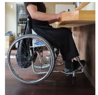
ローカウンターの設置