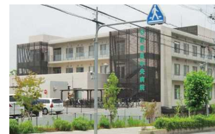
病院の誘致（奈良学園前・鶴舞団地/奈良県）