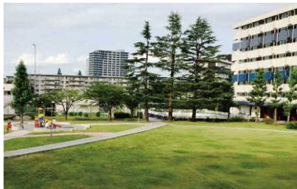
団地内広場の整備（みさと団地/埼玉県）