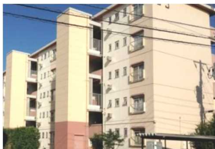
中層住棟へのエレベーター設置 (相模台団地/神奈川県)