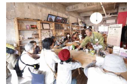
コミュニティスペースの設置 (男山団地/京都府)