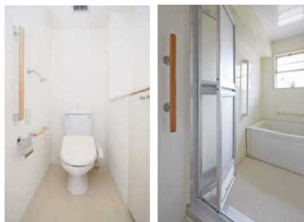
住戸内への手すりの設置