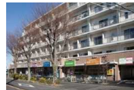
医療・介護施設等を併設したサービス付高齢者向け住宅の誘致（豊四季台団地/千葉県）