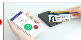
イベント用カードリーダー： iPhone + Bluetooth接続の カードリーダー