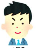
北海道 下請専門工事業者

「まだ利用し始めたばかりだが、思っていたよりも難しくない。操作も、簡易マニュアルボタンのお陰でスムーズに入力出来ている。証紙の管理がなくなって、枚数を確認しながら証紙を貼り付ける作業がなくなったのでとても楽になった。」