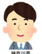
神奈川県 下請専門工事業者

「証紙を貼ったり、手帳をコピーする手間が省けたので楽になった。証紙を購入するために銀行へ行く手間や、証紙購入のために記入していた掛金収納書も書かずによくなったので全体的に建退共事務が楽になった。購入代金の支払いもインターネットバンキングですることができ、掛金収納書も印字できるのでそこもいい点だと思う。下請へ工事情報を渡す時も、下請から就労報告もらう時もメールでのやりとりだけになったので楽。様式も簡単に印刷できるのでいい。」