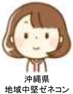
沖縄県 地域中堅ゼネコン

「まだ利用し始めたばかりだが、思っていたよりも難しくない。操作も、簡易マニュアルボタンのお陰でスムーズに入力出来ている。証紙の管理がなくなって、枚数を確認しながら証紙を貼り付ける作業がなくなったのでとても楽になった。」