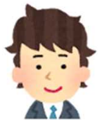
奈良県 地域中堅ゼネコン

「毎月、必要数のみをその場で購入することができるため、貯藏品(証紙)を持つ必要がなくありがたい。証紙の貼付は生産性のない作業だったため、簡略化できありがたい。」