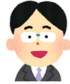
山梨県 地域中堅ゼネコン

「簡易的なヘルプがHPですぐに見られるのは助かる。これまで半日近くかかっていたような証紙貼り等の作業が大きく省かれ、楽になった。」