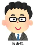
長野県 下請専門工事業者

「就労実績報告作成ツールは、1度操作を覚えれば、とても便利で使いやすいと思う。電子申請専用サイトは、証紙の購入、貼付をしなくて良いので大変便利。」