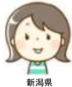
新潟県 地域中堅ゼネコン

「自社工事分として手帳保持者全員分を一度に処理できて、証紙貼り付け・押印・手帳更新作業が無くなりとても楽になった。最初は電子申請も時間がかかったが、慣れればとても便利だと思う。」