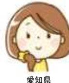
愛知県 下請専門工事業者

「電子申請専用サイトは複雑な作業もないので分かりやすい。証紙を一枚一枚貼付していた時と比べるとはるかに作業効率が上がり、楽になった。確実に就労者本人へ払い出しを出来る所が良い。」