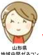
山形県 地域中堅ゼネコン

「就労実績報告作成ツールは、被共済者を登録しておくことで、被共済者の氏名・手帳番号等の入力手間を省ける。就労実績報告作成ツールのみでも一般的に広がれば入力手間は大幅に減ると思う。」