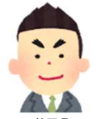
静岡県 地域中堅ゼネコン

「大変便利、よく使っている。作業員等のデータなども蓄積されていくので、助かっている。電子申請専用サイトは、使い始めたばかりだが、便利に使える。工事別業者別一覧は様式としてでるので、集計も一目瞭然なので、使いこなせば大変便利になると思う。周知してくれている業者もいて、建退共事務の簡素化ができると思う。」