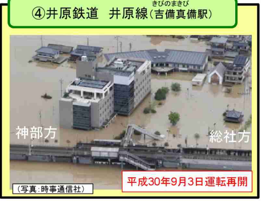
鉄道の主な被害等について(中国地方)