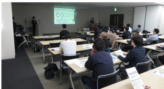
米山運輸部長による開会挨拶

http://www.ogb.go.jp/unyu/9280/007029 に掲載を予定しておりますのでご参照下さい。