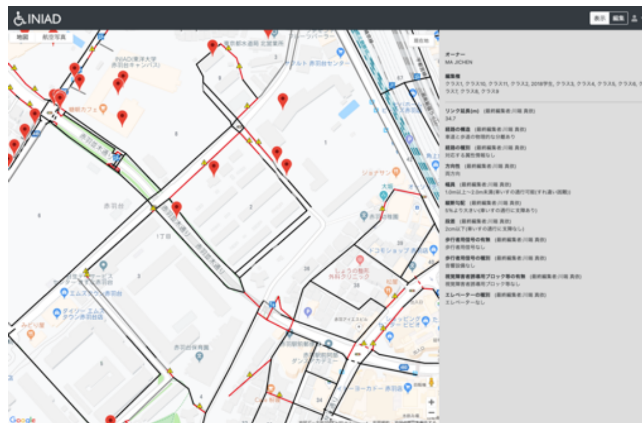
5%より大きな勾配を注意するモード