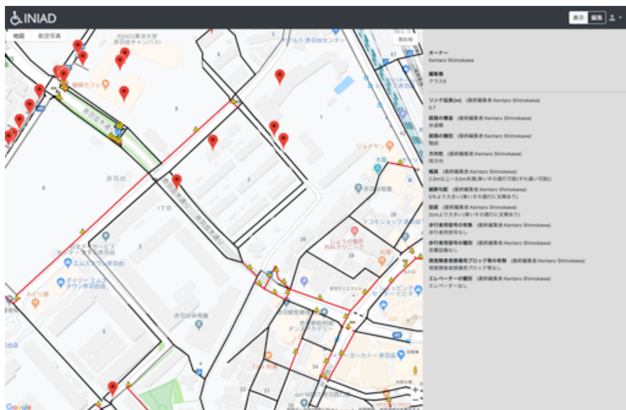
2cm以上の段差を注意するモード