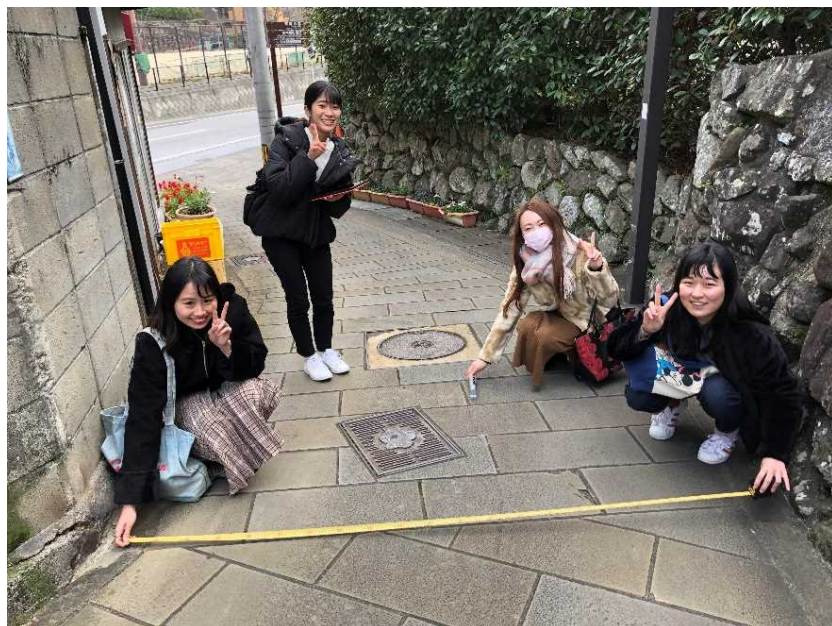
<長崎県立大の学生による現地調査の様子>