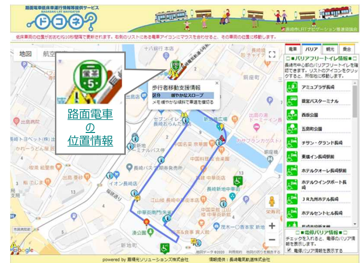
<「あっと！ながさき」による施設のバリアフリー情報の提供>