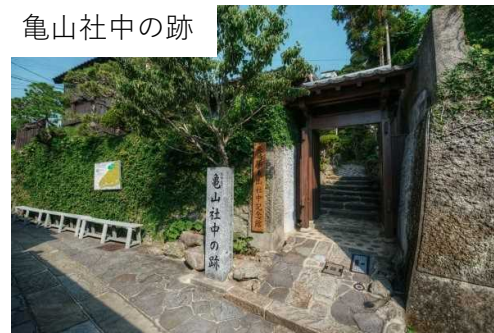
<長崎市内の観光地例>