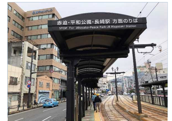
<長崎電気軌道（路面電車）>