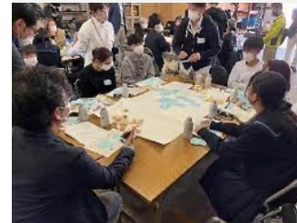
実績(竹原駅 | 駅前エリアデザインワークショップの協力)

竹原駅前エリアで、居心地が良く歩きたくなる「ウォーカブル」な空間を創出していくため、竹原駅利用者および、周辺住民、駅前活性化PJT推進メンバーを中心に、ワークショップ及び実証実験を行い、竹原駅及び駅周辺において活性化に必要なコンテンツを抽出します。