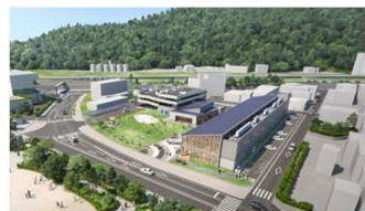
【木造・ZEBによる自社複合施設の建設】

・九電グループの技術力を用い、木造+ZEB施設を建設した実績から、ニーズに沿った普及促進支援が可能（ZEBリディングオーナー登録）