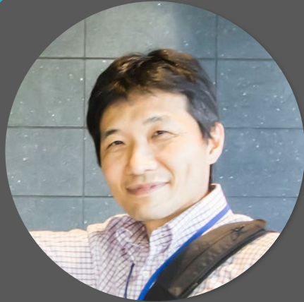
石原 従道 Tsugumichi Ishihara