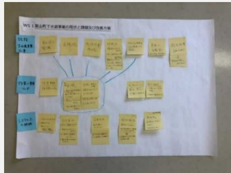
ワークショップによる職員間の課題認識の共有