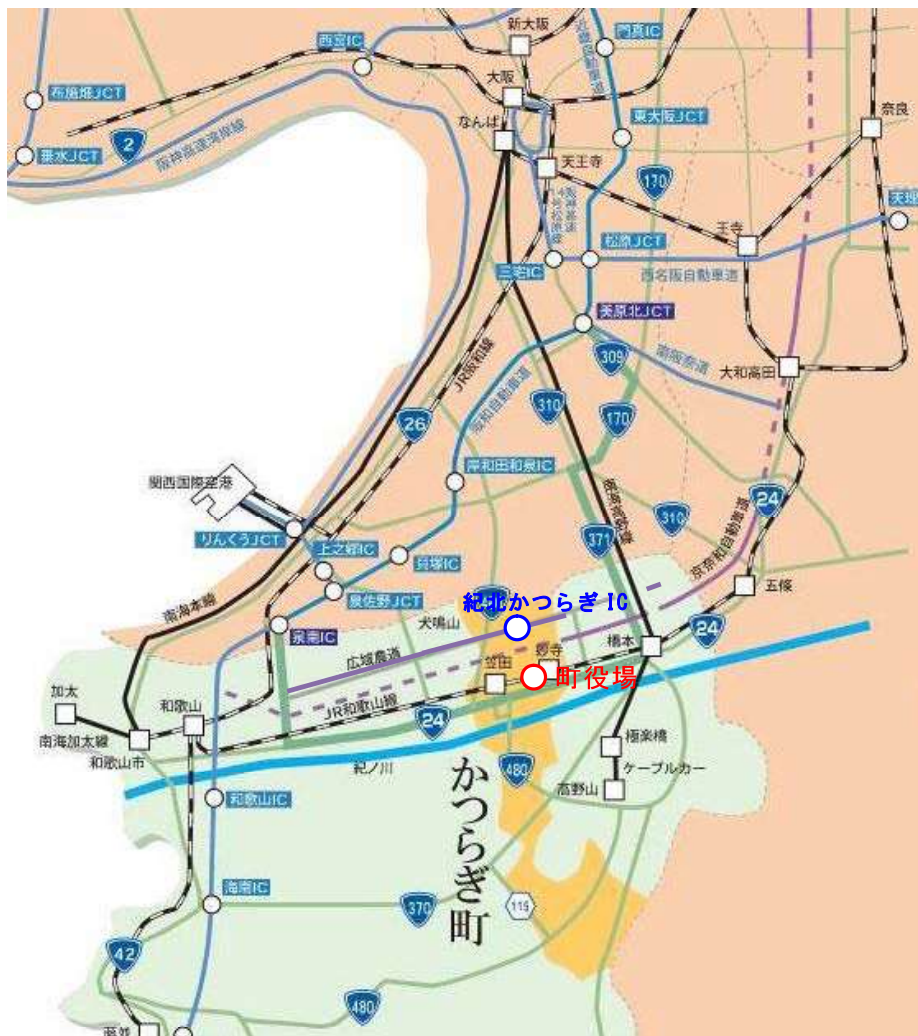
図 1-1 : かつらぎ町位置図 (出典 : 町勢要覧を加工)

道路交通状況は、奈良県に通じる国道 24 号、大阪府に通じる国道 480 号、県内を結ぶ国道 370 号が町内を縦横している。鉄道は JR 和歌山線が紀の川と平行して走っており、和歌山市方面と橋本市方面と連絡し、南海高野線は橋本市を經由して大阪府下と結ばれている。和歌山市、大阪市中心部への所要時間は約 1 時間となっている。