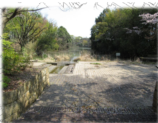
池に面した広場空間