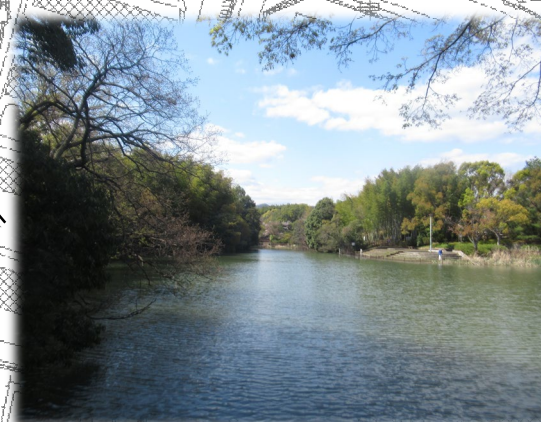
池越しに眺める西山と竹林