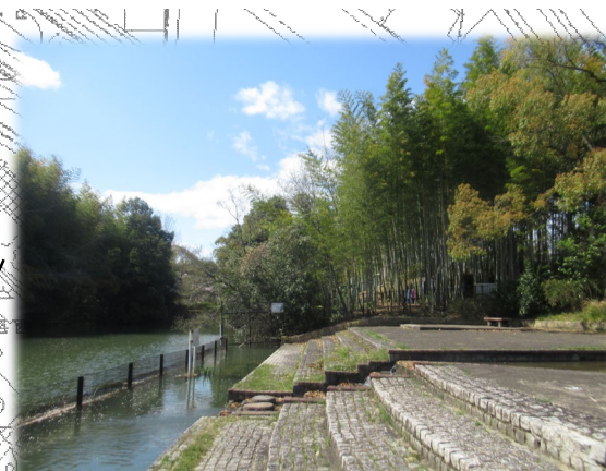
池に面した広場空間