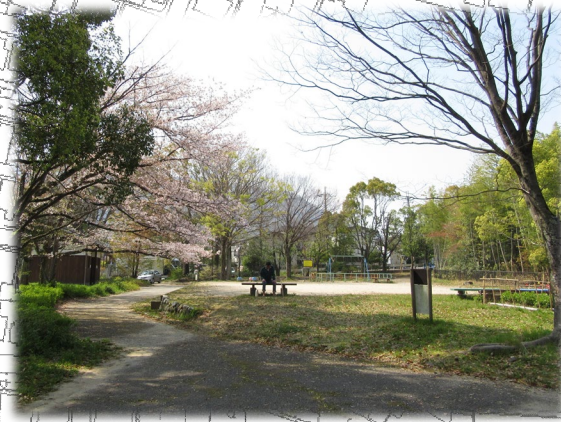
開放的な広場と新しいトイレ