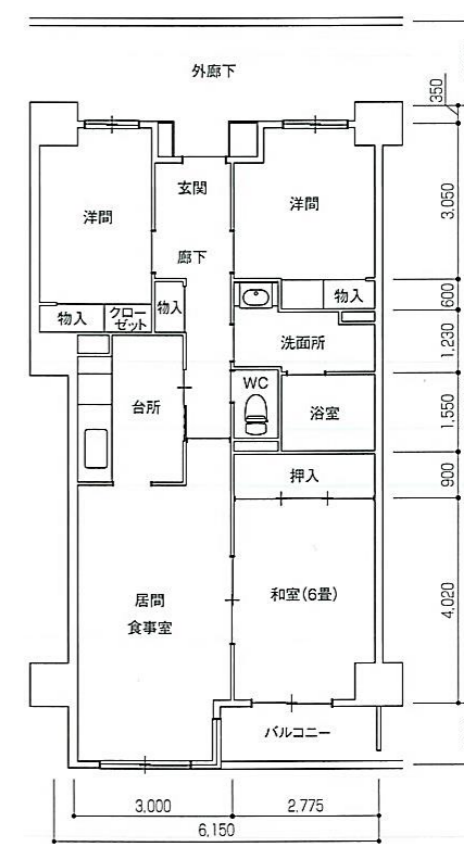
Dタイプ 3LDK 住戸専用面積 70.78 m 2