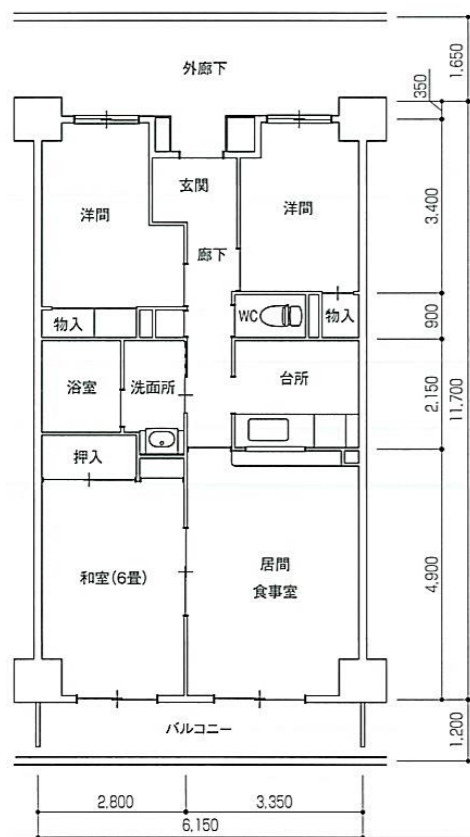
Eタイプ 3LDK 住戸専用面積 68.40 m 2