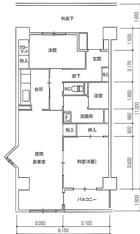
Aタイプ 2LDK 住戸専用面積 67.79 m 2