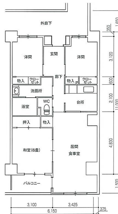
Cタイプ 3LDK 住戸専用面積 73.35 m 2