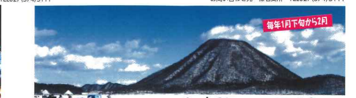
毎年1月下旬から2月

榛名湖マラソン大会 42.195キロのフルマラソン。美しい榛名湖畔をグルグル走る有景コース。高低差激しいコースを走りきるのが見どころ。例年、9月下旬開催。 お問い合わせ先 榛名支所 TEL027(374)5111