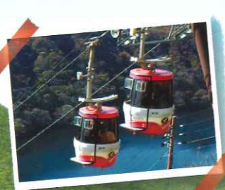
▲榛名ロープウェイ

高原から榛名富士の山頂を結ぶ2両連結ロープウェイです。山頂からは、榛名湖と上州の山々が望めます。大抵は榛名富士山スカイツリーが見えることが特徴です。 お問い合わせ先 榛名山ロープウェイ TEL027(374)9238