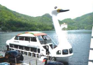
はくちょう丸II世号 ボート乗り場C

高原から榛名富士の山頂を結ぶ2両連結ロープウェイです。山頂からは、榛名湖と上州の山々が望めます。大抵は榛名富士山スカイツリーが見えることが特徴です。 お問い合わせ先 榛名山ロープウェイ TEL027(374)9238