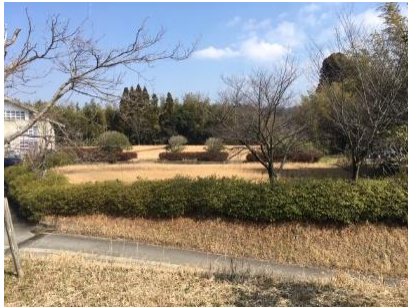
ロ 旧ゲートボール場