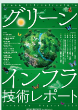
グリーンインフラ技術レポート