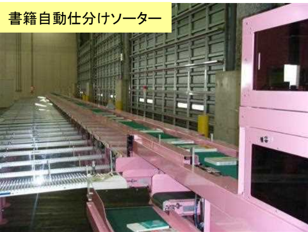
書籍自動仕分けソーター