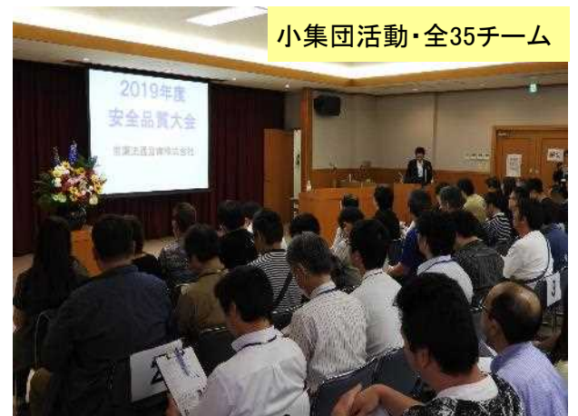
小集団活動・全35チーム