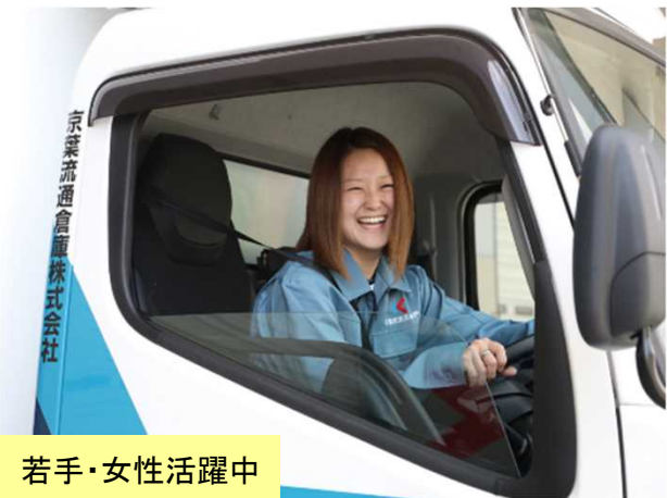
若手・女性活躍中