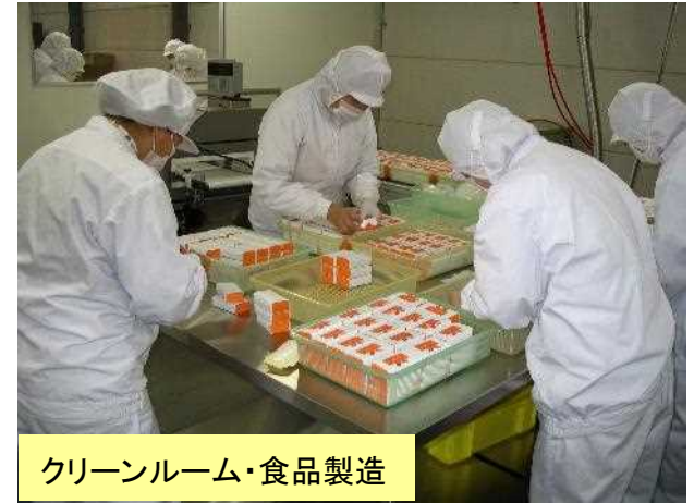
クリーンルーム・食品製造