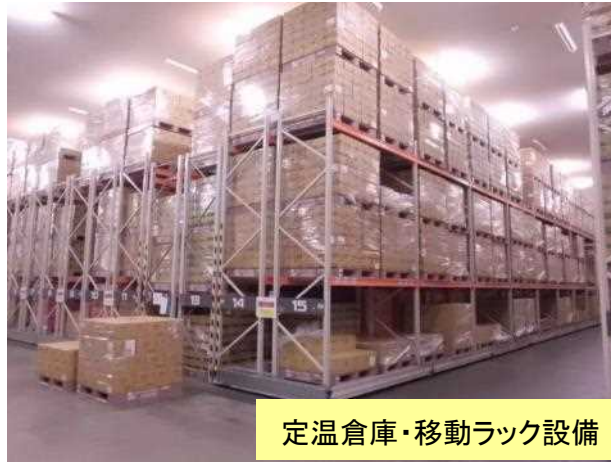
定温倉庫・移動ラック設備