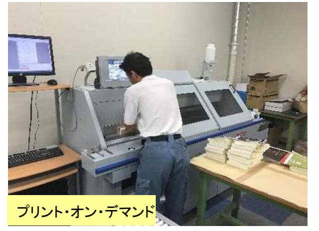
プリント・オン・デマンド