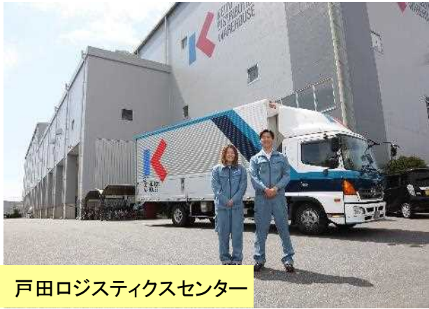
戸田ロジスティクスセンター