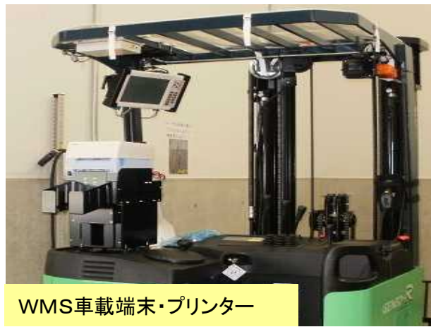
WMS車載端末・プリンター