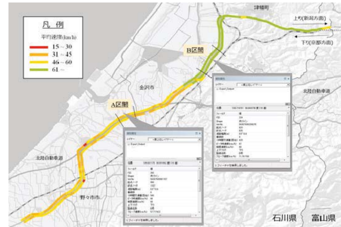
図 国道8号(金沢市・野々市市・津幡町)の朝8時の走行速度地図

点検調査等を用いて、道路ネットワーク上の重要拠点の接続性を考慮した組み合わせ最適化の枠組みで「維持管理を優先的に実施すべき場所」を特定する方法を開発した。そして、斜面調査を用いてこの方法を石川県のネットワークに適用した。