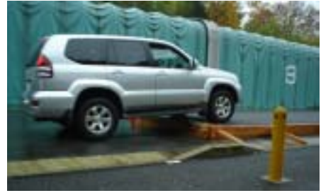
図-1 段差走行試験の状況（段差25cm）

前年度に整理した中越地震における段差規模と震度階との関係について、関越自動車道のデータを追加し、段差規模と震度階の関係を集約した。さらに、段差規模に応じた車両の走行性を定量的に評価するために、模擬段差に対する車両走行試験を行い、段差高、走行速度とドライバーの走行感覚等の関係を把握するとともに、地震直後における車両走行の運用基準（試案）を作成した。