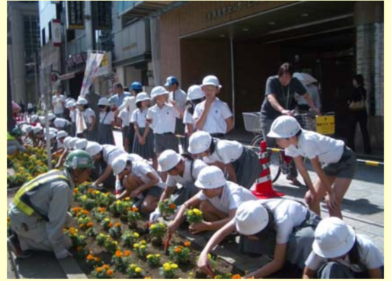
【地元小学校児童体験花植えの様子】 参加小学校： ○中央区立常盤小学校 ○中央区立城東小学校