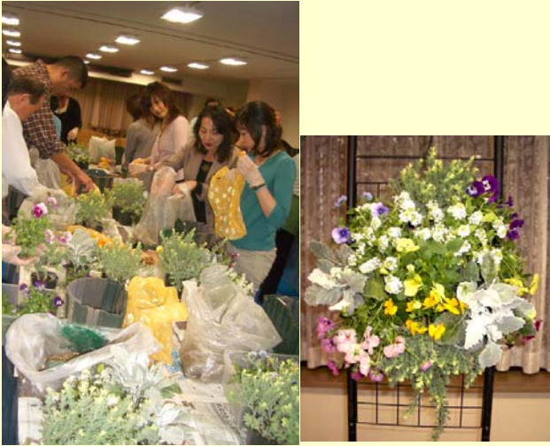
【2006年秋ハンギングバスケット教室】