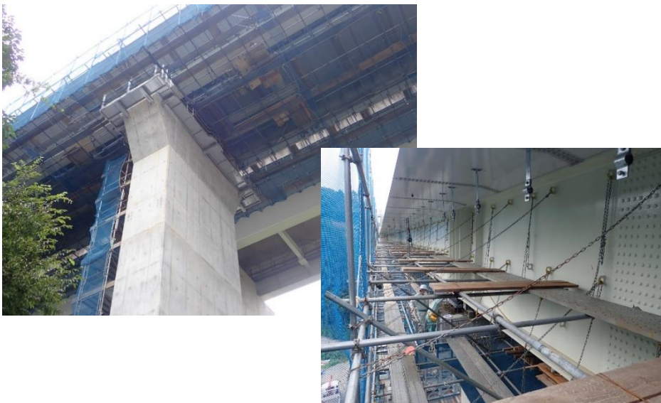
従来型のパイプ足場の一例