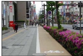
自転車歩行者道(走行位置明示)