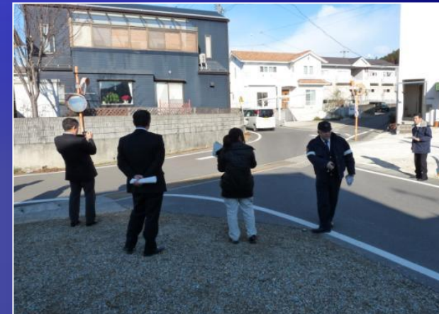
通学路の交通安全点検 岐阜県