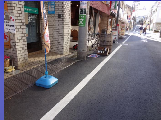
大人の都合で塞がれた歩道