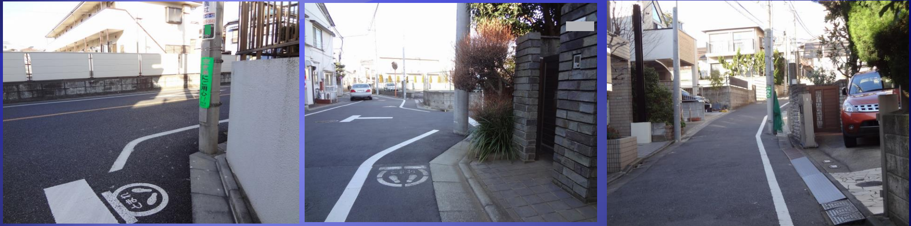
曲がり角に設置された電柱