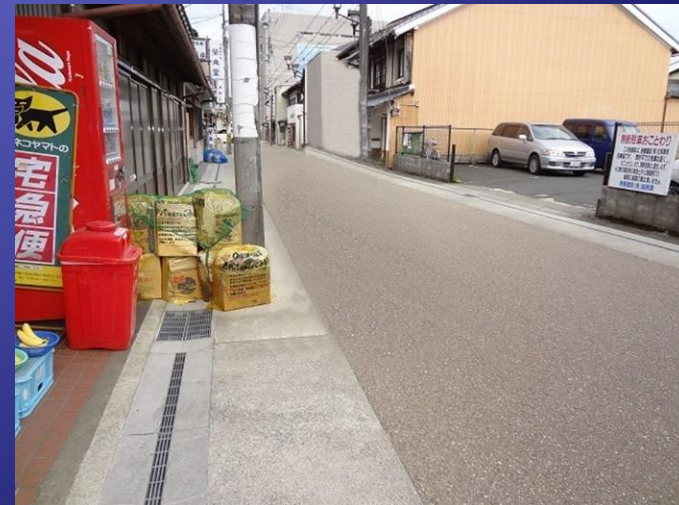
時間・曜日・天気・季節等によって変化する危険