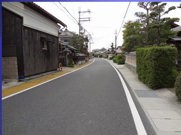
2012年 亀岡市交通事故