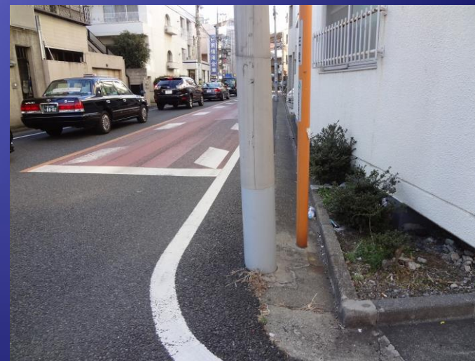
曲がり角の電柱に集中する標識等