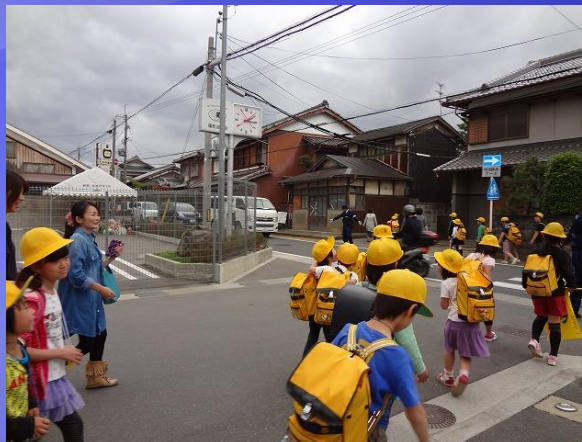
事故後の通学風景