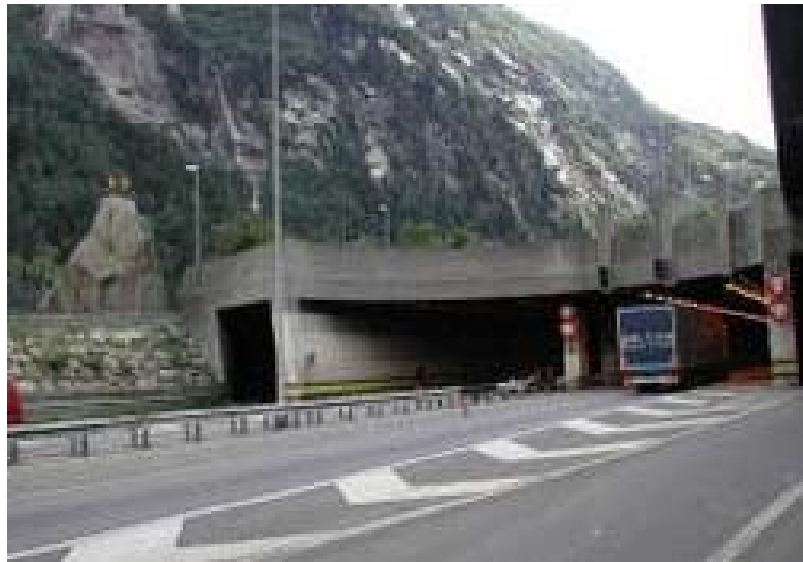
ゴットアルド道路トンネルの出入り口