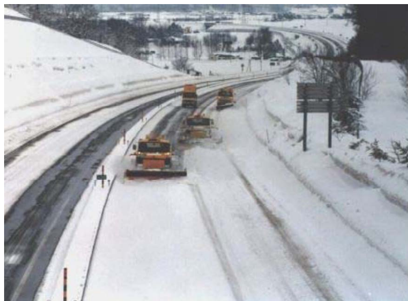
新雪除雪時における作業例