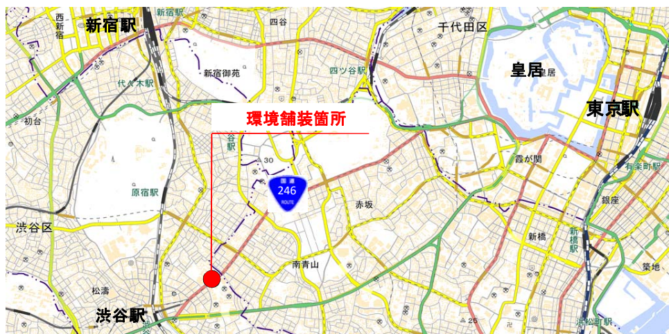
■国道246号 現地効果検証箇所位置図