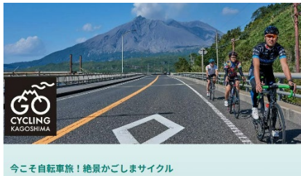
今こそ自転車旅! 絶景かごしまサイクル