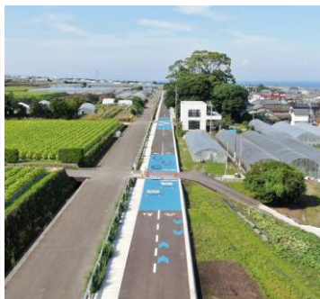
自転車歩行者専用道路 (南島原市) 鉄道廃線敷きを活用