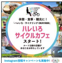
(ハレいろサイクルカフェ広告)