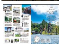
(専門誌: Cycle Sports)