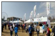
(サイクルイベント)