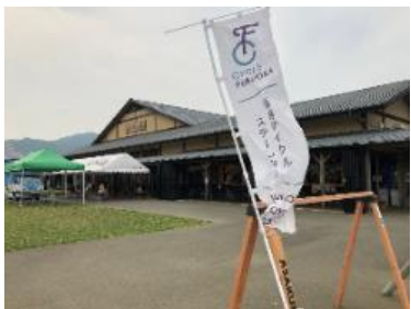
(福岡サイクルステーション)