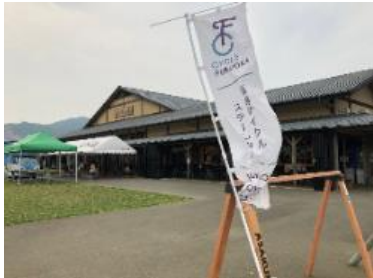
(福岡サイクルステーション)