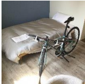
(サイクリストに優しい宿)