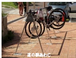
(サイクルラック設置状況)