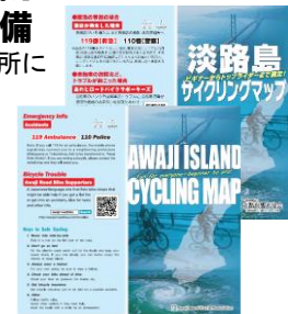
(サイクリングマップ、日英2カ国語)

自転車走行台数(2022年度実測) 洲本市小路谷:1.2万台 南あわじ市福良丙:1.0万台 淡路市郡家:2.3万台