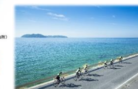
南淡路水仙ラインと沼島