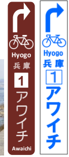
(案内標識)(路面表示)