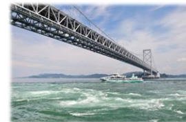
大鳴門橋と鳴門海峡の渦潮

延長 : 150km 最大標高差 : 156m 獲得標高 : 1,144m 所要時間 : 約10時間