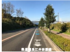
(矢羽根型路面表示)