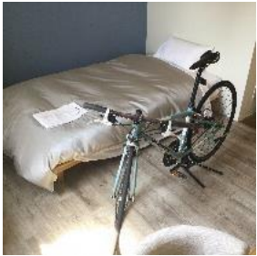
(サイクリストに優しい宿)