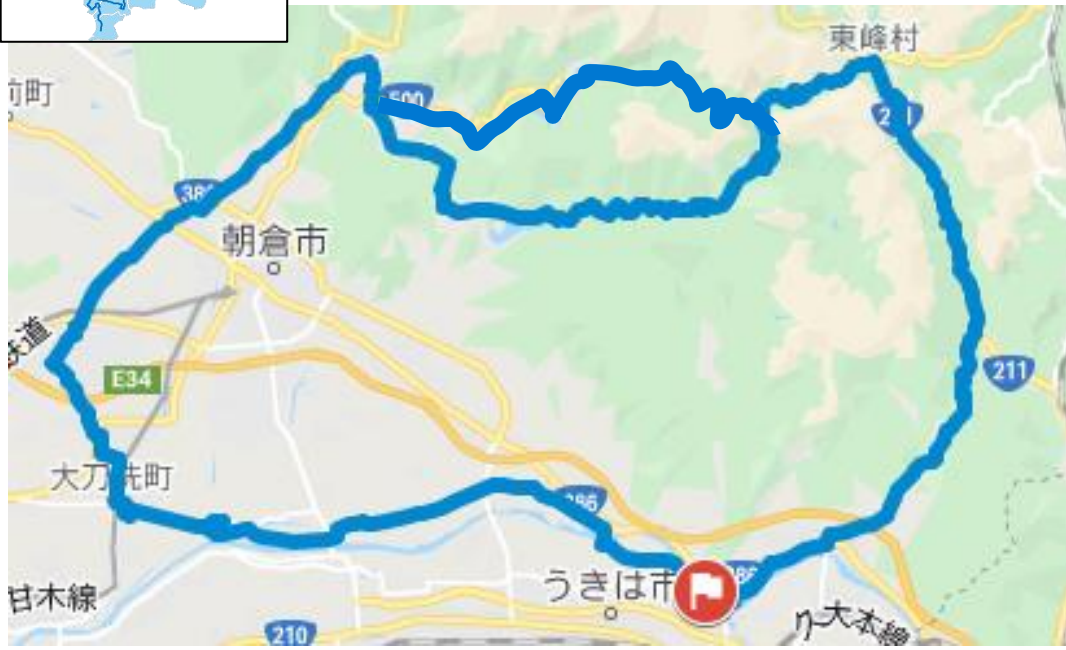
(距離 約85 km)