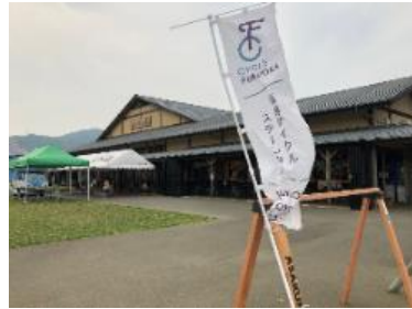
(福岡サイクルステーション)