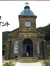
頭ヶ島教会 ビューポイント