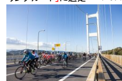
サイクリングしまなみ2022