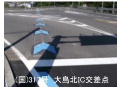
(国)317号 大島北IC交差点