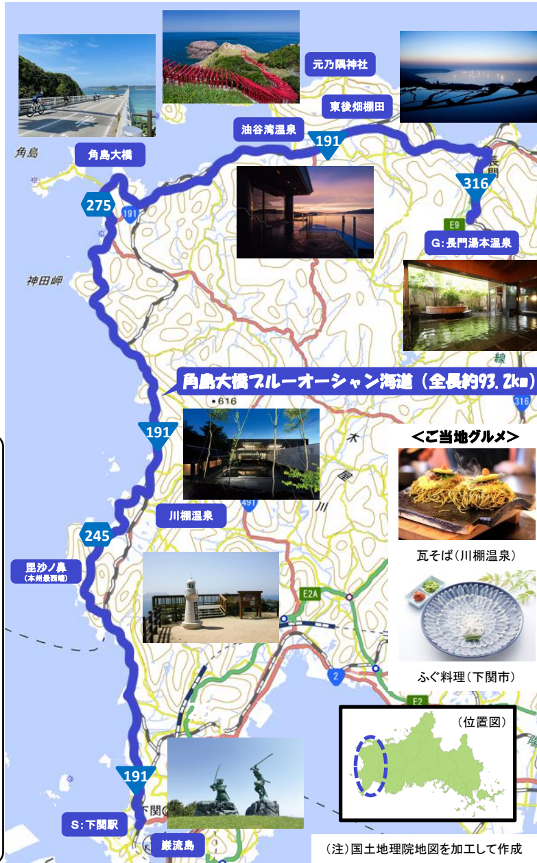
(注)国土地理院地図を加工して作成