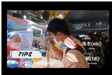
官学連携による外国人向け動画の作成