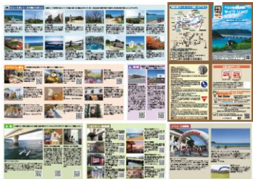
ロングライド層向け詳細版マップ