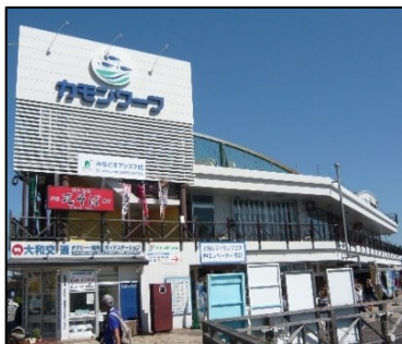
構成施設のイメージ (下関港、カモンワーク)