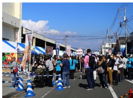
地域振興イベントの開催状況 (Sea級グルメ全国大会in沼津)