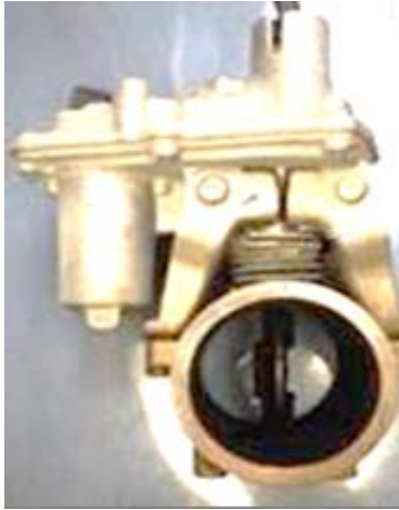
排気ブレーキ 一式