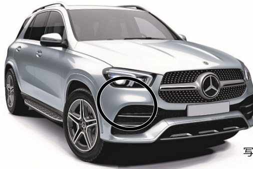
写真は左ハンドル仕様車