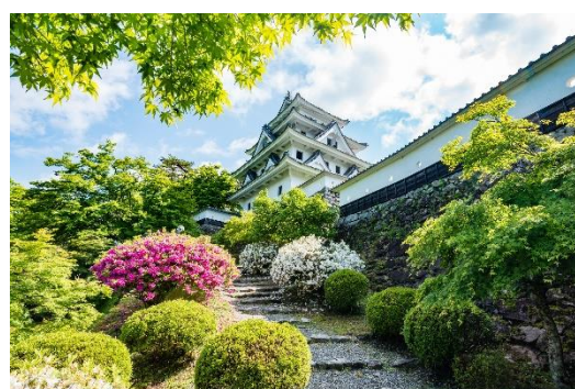
耐震補強工事を終えた郡上八幡城