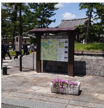
案内板等整備事業