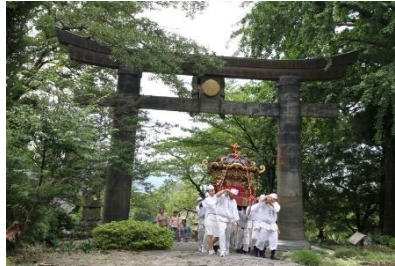
【添田町】英彦山神宮参道沿いにある 重要文化財・英彦山神社 銅鳥居での神幸祭