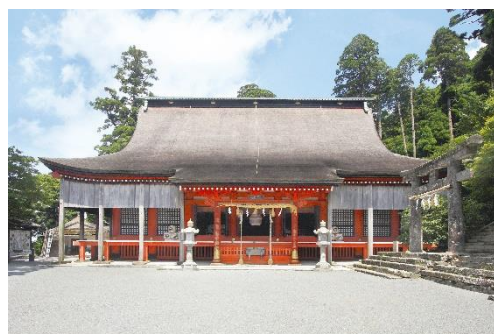
英彦山神社奉幣殿 1 （重要文化財）