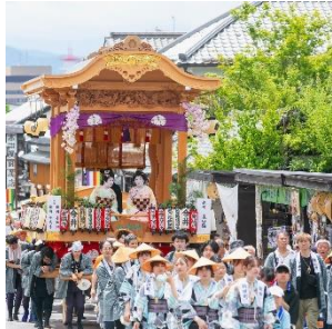
【長野市】ながの祇園祭 （弥栄神社の御祭礼・屋台巡行）

長野市、郡上市、名古屋市、斑鳩町、添田町、竹田市の歴史まちづくり計画（第2期）について、 歴史まちづくり法に基づき、3月18日付けで主務大臣（文部科学大臣、農林水産大臣、国土交通大臣）が認定 します。（各認定都市の詳細は別紙参照）