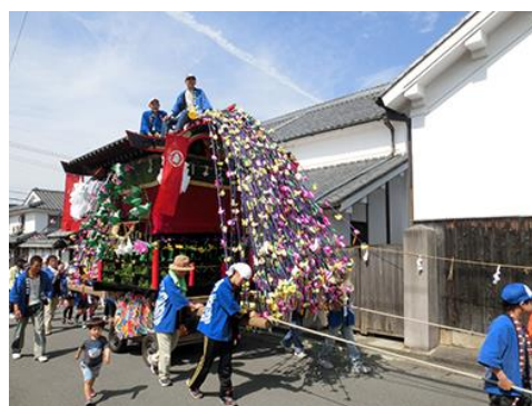
重要文化財・中島家住宅の前を練り歩く神幸祭