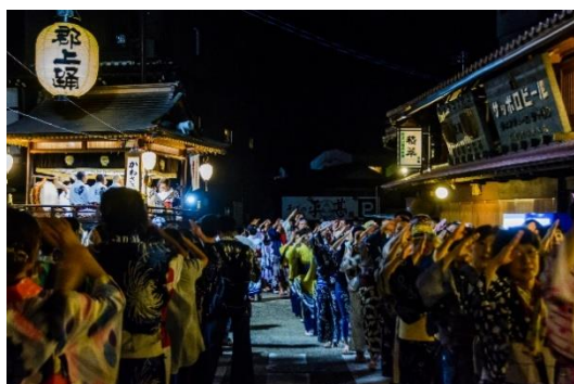
郡上踊(ユネスコ無形文化遺産「風流踊」の1つ)

第2期計画では、引き続き、重点区域内の歴史的建造物や道路の修理修景事業等を通して、歴史的風致の環境整備を行うとともに、今後策定予定の「郡上市文化財保存活用地域計画」や「郡上おどり保存活用計画」などの各種計画の連携を強化して、歴史的風致の維持・向上を図っていきます。また、新たに歴史的風致の区域を増やし、市民の歴史まちづくりへの意識向上を図り、地域の活性化を進めていきます。