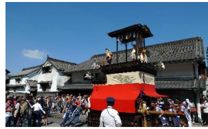
【名古屋市】有松地区の東海道を曳かれる山車