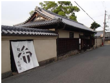
【斑鳩町】井上家住宅 （歴史的風致形成建造物の1つ）