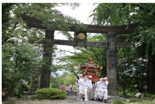
英彦山神宮参道沿いにある重要文化財・英彦山神社銅鳥居 2 での神幸祭

第2期計画では、第1期計画で進められなかった周辺景観に配慮した公共施設の修景整備、第1期計画で保存整備が進められた中島家住宅の活用を促す環境整備、文化財指定が進められた英彦山の整備など、第1期計画の事業成果をより高めてまいります。また、民俗芸能等の活動支援や子供たちへの歴史的風致の学習の機会の提供等による町民の郷土愛の醸成、国内外に向けた魅力発信をしてまいります。