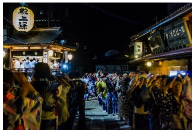
【郡上市】郡上踊 （ユネスコ無形文化遺産「風流踊」の1つ）