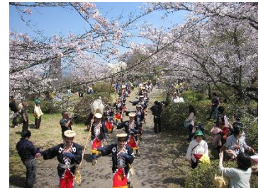
【竹田市】岡城桜まつりで行われる 大名行列