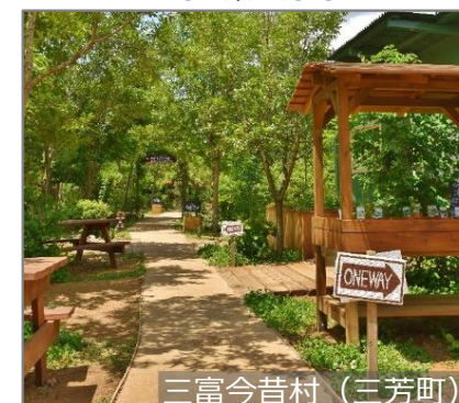
三富今昔村 (三芳町)