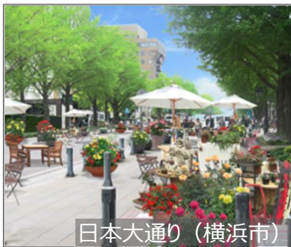
日本大通り (横浜市)