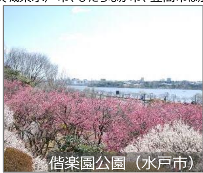
偕楽園公園 (水戸市)