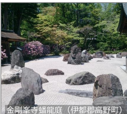
金剛峯寺蟠龍庭 (伊都郡高野町)