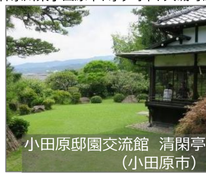
小田原邸園交流館 清閑亭 (小田原市)