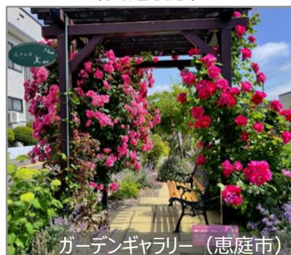
ガーデンギャラリー (恵庭市)