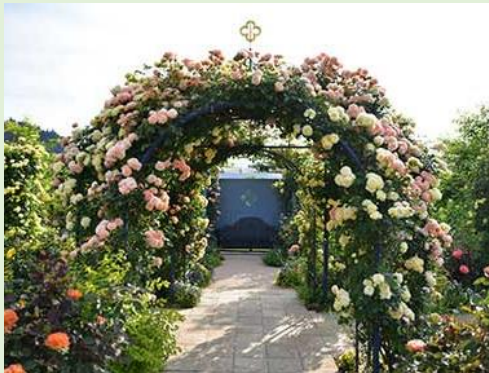
中之条ガーデンズ(吾妻郡中之条町)

～“花と人とのつながり”で創る Hot なる花のまち巡り～ ぐんま花の駅ネットワーク推進協議会