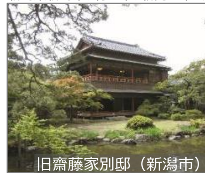
旧齋藤家別邸 (新潟市)