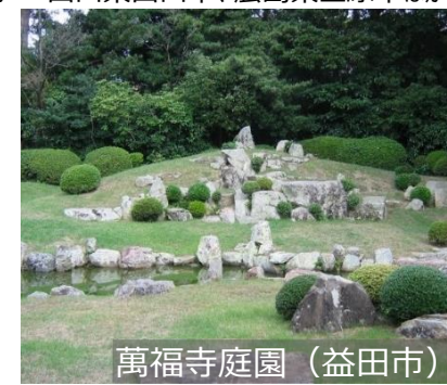
萬福寺庭園 (益田市)