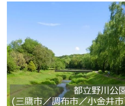
都立野川公園 (三鷹市/調布市/小金井市)