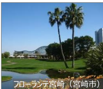
フローランテ宮崎 (宮崎市)