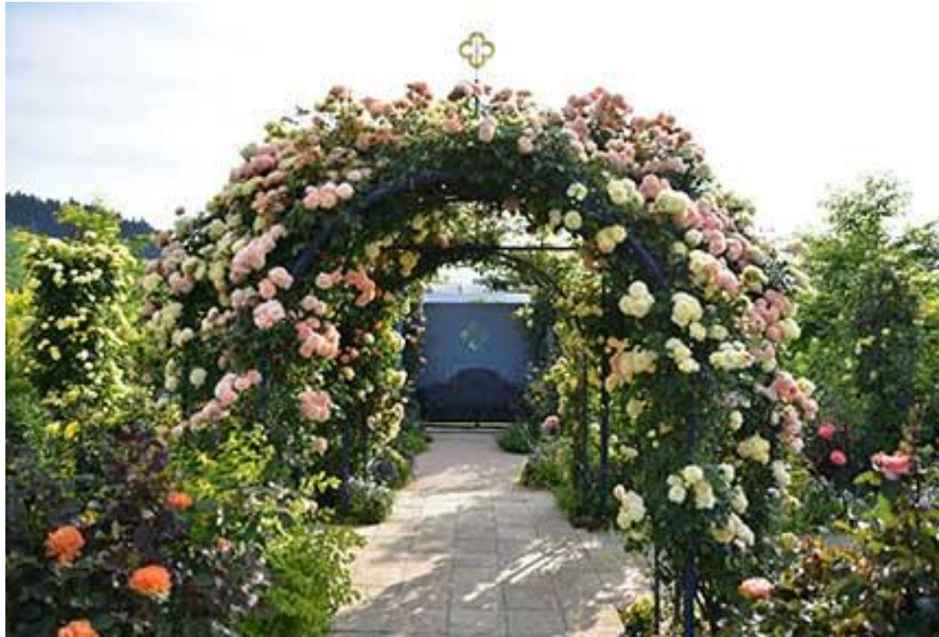
中之条ガーデンズ(吾妻郡中之条町)

～“花と人とのつながり”で創る Hot なる花のまち巡り～ ぐんま花の駅ネットワーク推進協議会