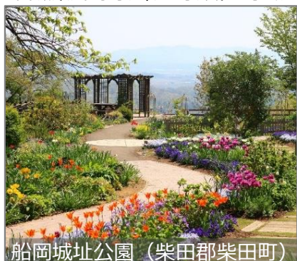
船岡城址公園 (柴田郡柴田町)