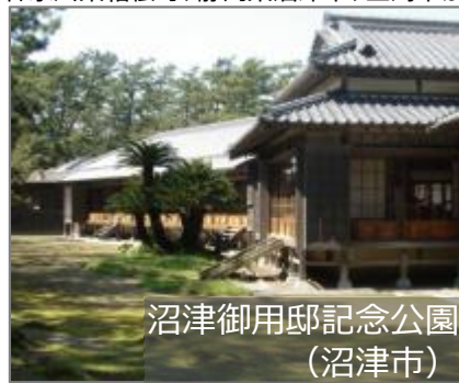
沼津御用邸記念公園 (沼津市)