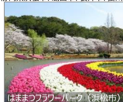
はままつフラワーパーク (浜松市)