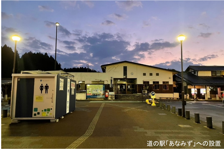
道の駅「あなみず」への設置