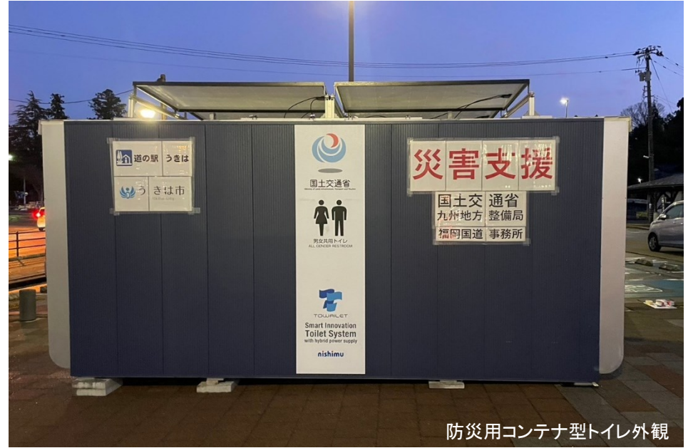
防災用テナ型トイレ外観