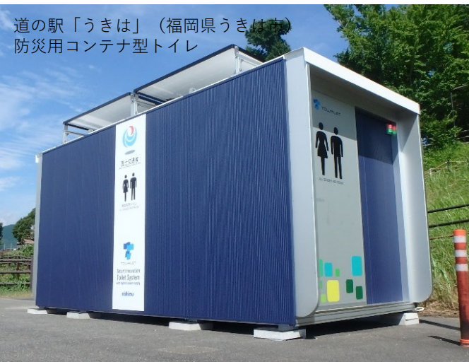
道の駅「うきは」(福岡県うきは市) 防災用コンテナ型トイレ