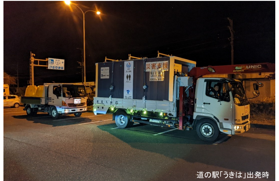
道の駅「うきは」出発時