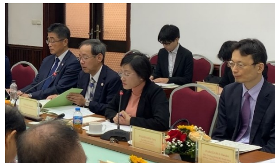
上原国土交通審議官（左から2人目）