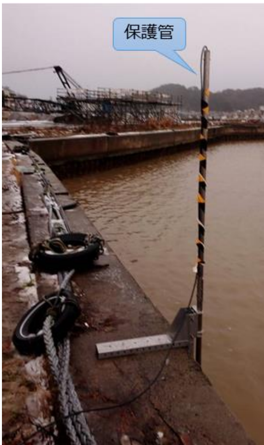
②岸壁への設置状況