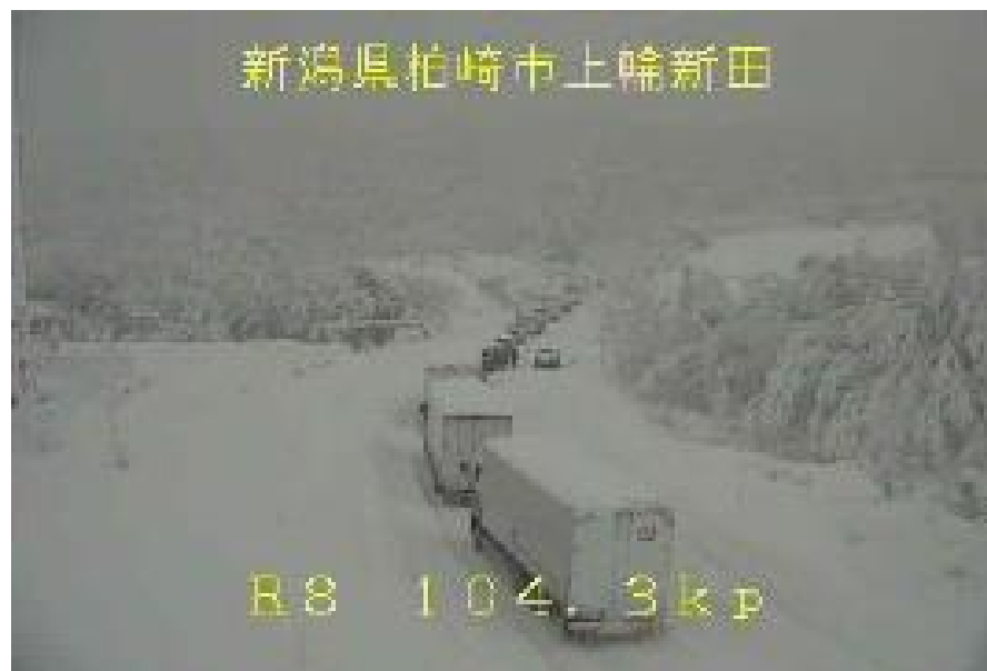
車両の滞留 <国道8号>