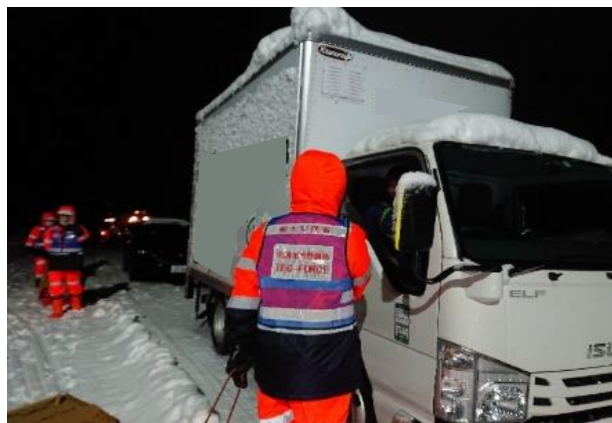
支援物資の配布 <国道8号>