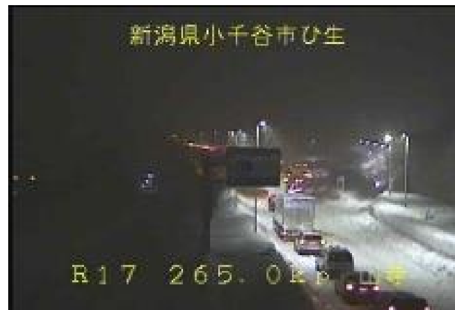
車両の滞留 <国道17号>