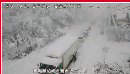
新潟県柏崎市新赤坂四丁目 下り 令和4年12月19日 国道8号(登坂不能車による交通障害の発生状況)