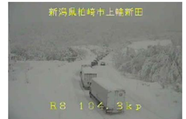
新潟県柏崎市上峰新田 国道8号の車両滞留状況 <令和4年12月19日>

○新潟県見附市から長岡市の国道8号・17号では、車両の立ち往生が断続的に発生し、12月20日3時から32.7kmが通行止めとなり、全面的な通行止めの解除までに約29時間を要しました。