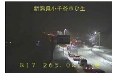
新潟県小千谷市ひ生 国道17号の車両滞留状況 <令和4年12月20日>