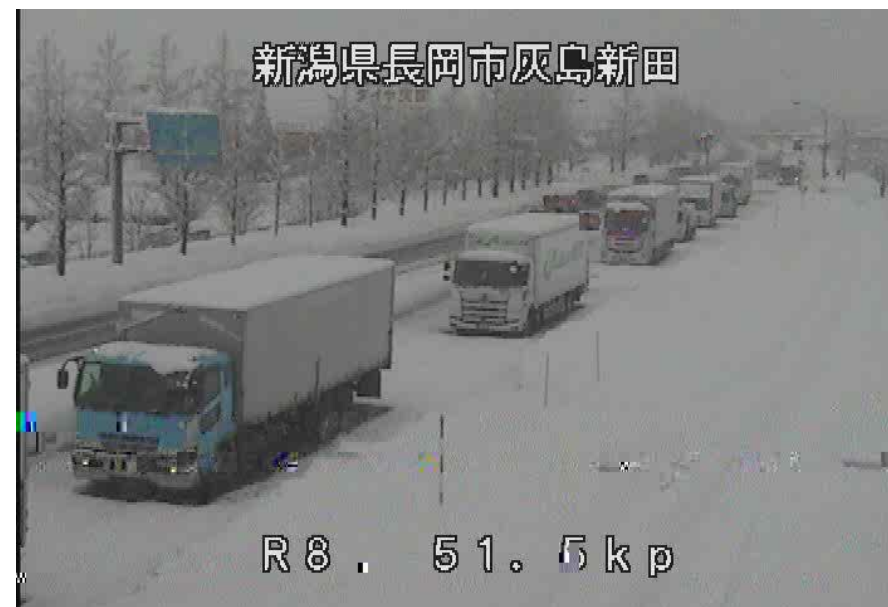
車両の滞留 <国道8号>